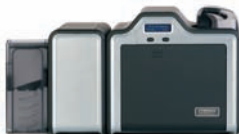
Kartendrucker/Kodierer für beidseitigen Druck