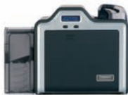
Kartendrucker/Kodierer für einseitigen Druck