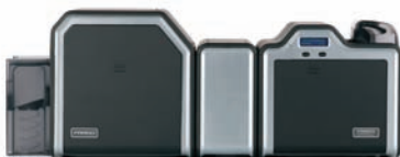
Laminiereinheit und Kartendrucker/Kodierer für beidseitigen Druck